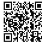
利用者登録申請 書兼同意書